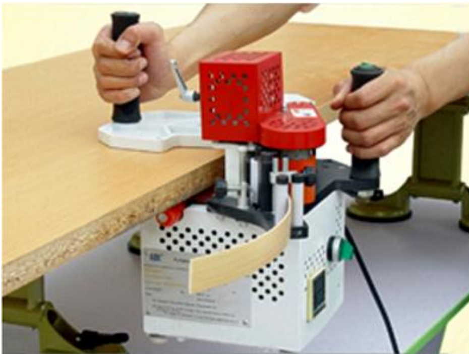
Anwendungsbeispiel gerade Kanten