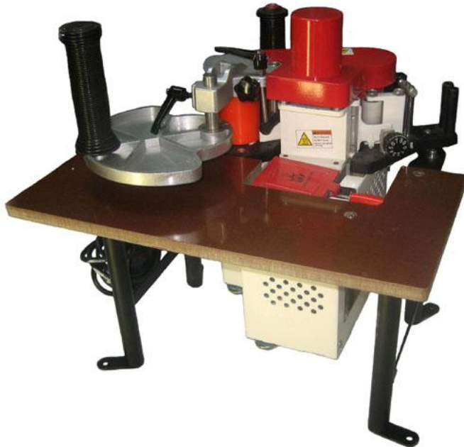
Der im Lieferumfang enthaltene Maschinentisch ermöglicht stationäres Arbeiten