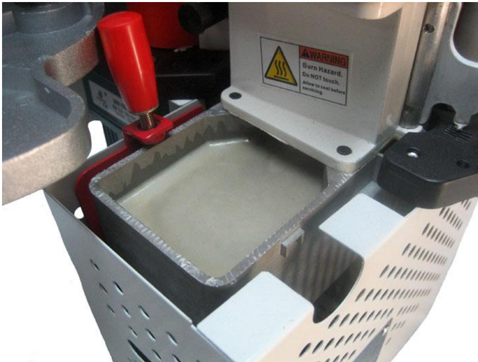
Schmelzwanne mit einem Fassungsvermögen von 0.27 Litern

Neumaschinen / Gebrauchtmachines / Service